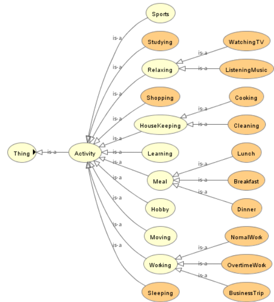
図 3: 行動の定義

本稿では、高次な行動イベントを検出するためのオントロジについて説明した。今後は、さらに行動の定義を追加し、オントロジを拡張する予定である。また、行動オントロジを用いた高次な行動イベントの検出ができることを確認する。