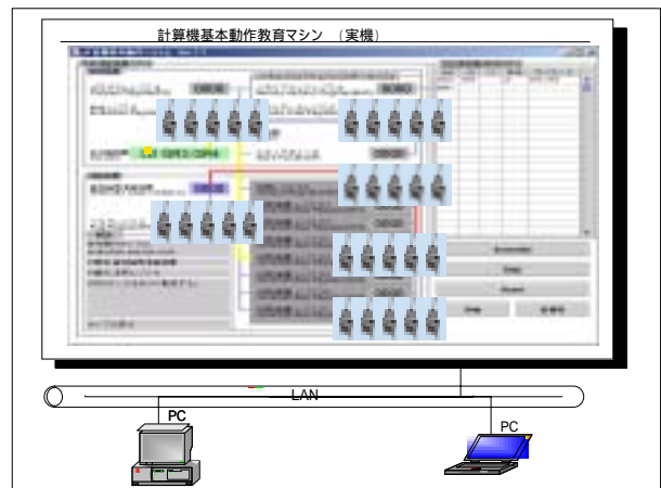
図3. 計算機基本動作教育マシンの概要

現在，本方式を図3および以下の特徴に示す計算機基本動作教育マシン [4] の開発に適用し，本方式の実行可能性，有効性を検証する（図3参照）．