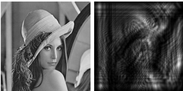
図4: CWOライブラリを用いて計算した回折強度パターン

図2の計算速度は元画像が1,024×1,024画素の場合、CPU (Intel Core i7 740QM) の1スレッドで約230ms、GPU (GeForce GTX580) を使用した時に2msとなっている。CWOPy (図3) の場合も、CWO++と同じ低レベルライブラリを使用しているため同様の計算速度となる。