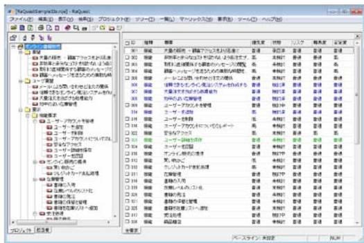
図3 要求定義ツールのイメージ

RaQuest とは、スパークスシステムズ ジャパンが提供する、図3のような要求管理のためのツールで概要や詳細な情報を入力する事ができ、HTMLやWordドキュメントとして出力が可能である。また、入力された要求間の関係からインパクト分析やカバレッジ分析に役立つ関係図やマトリックス表示を行うこともできる。要求管理とは直接関係ないが、Enterprise Architect を使用する事でUMLのユースケースとしての生成や読み込みも可能である。今後、上記のツールや手法との差や共通点を研究していく予定である。