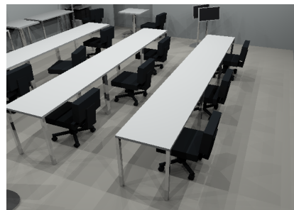
図 1 DIALux と POV-Ray を用いた出力画像