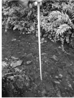
図 3 水路実験計測