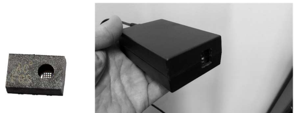
(左) Multi-spectral Sensor AS7341

一方、UAVは、主にサービス事業者が操縦可能な障害物が付近にないことを想定した平地部や、森林高さを超える上空から撮像するため、障害物付近や枝葉が生い茂る森林内での航行にはより高度な制御技術の搭載が必要である。また、中小の農業事業者にとってかかるコストが無視できないという問題が生ずる。彼らのニーズは、水路のどの地点が枯渇し水流の妨げとなっているか、必要な灌水が可能かを見極めることであり、より安価で簡易な手法を望む。本手法は、該当する地点に設置あるいは移設が可能なモニタリングポストと成り得る。