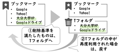
図 3 オートデリートとリカバリ機能の関係

復元は、T フォルダ内のブックマークに対してユーザがアクセスしたことをトリガーとして行われ、元のフォルダ構造へ自動的に戻す。削除前の親フォルダの情報は、事前に保存されており、それを参照して復元が行われる。