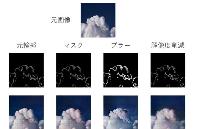
水平反転、輪郭に対するブラーを行うことでデータ拡張を

この節では提案手法の有効性を検証するために実施した実験とその結果について述べる。実験は CPU が Intel Xeon w7-2495X、GPU が NVIDIA RTX A5500 の計算機にて行った。学習に用いるデータセットとしては高画質な画像を提供するプラットフォームである Unsplash が提供している Unsplash API により雲の画像を 4800 枚取得し用いた。また、汎化性能を高めるためにランダムで学習画像に平行移動や