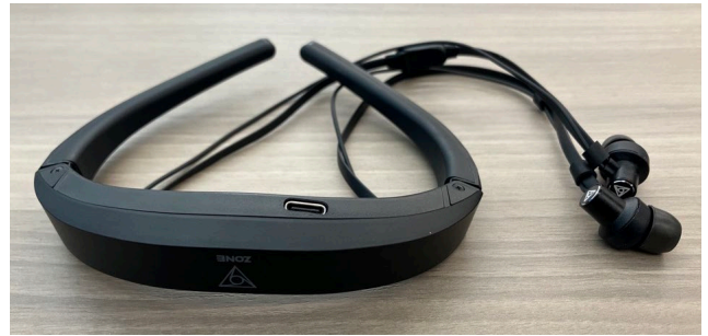
図 1 VIE Zone/Chill - Neuro Earphones

脳波の測定には VIE Zone/Chill - Neuro Earphones(図 1 以下 VIE)を用い、視線計測を行うアイトラッカーには Tobii Pro スパーク(図 2)を用いた。イヤホン型の脳波計測機である VIE と、メガネ型ではなく画面取り付け型の視線計測機である Tobii Pro スパークを用いることで、ユーザーが可能な限り普段に近い状態でサイトの操作が可能ないようにした。脳波については、右耳左耳それぞれの \delta 波(1~3Hz)と \beta 波(14~22Hz)の周波数帯の強度を z スコア標準化したものを取得し、視線に関しては、各操作でユーザーが提示されたタスクを進行するために必要となるリンクやボタン(以下 AOD)に視線が到達した時間を取得した。ただし、本研究で行った実験では視線計測の精度が低かったため、視線が到達した時間の代わりに AOI をクリックに要した時間も取得した。