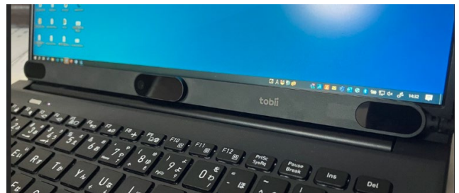
図 2 Tobii Pro スパーク