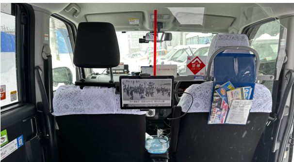
図1 車内に設置されたモニター

一般的なタブレット (Lenovo Tab M10 plus) をモニターとして使用し、タクシーの後部座席にタブレット用車載ホルダーを用いて図1のように設置した。