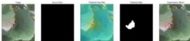
図 5 PaDiM で健康葉を異常葉と誤検出した例

誤検出した画像の異常推測箇所は、正常に検出できた画像と比較すると、異常と判定できている箇所が少ないことが確認できる。PaDiM では、図 3 のようなブドウ葉の変色している箇所の少ない部分の検出に弱いと考えられる。正常に検出できた画像では、葉の大部分が変色している画像が多いため、大きな異常がある画像に対して PaDiM は強いということが考えられる。図 5 では、注目した葉に他の葉が映り込んでいる。そのため、映り込んだ葉の変色した部分に反応してしまったと考えられる。これらの性質は、特徴抽出器で CNN の浅い層の特徴を抽出し、使用しているためと考えられる。CNN は、層が深くなっていくことでより細かい特徴を抽出することができる。対して PaDiM では、CNN の浅い層を使用しているため、大まかな特徴を抽出し、異常の検出に使用しているため、異常箇所がブドウの面積に対し大きい画像を判定しているのに優れていると考えられる。