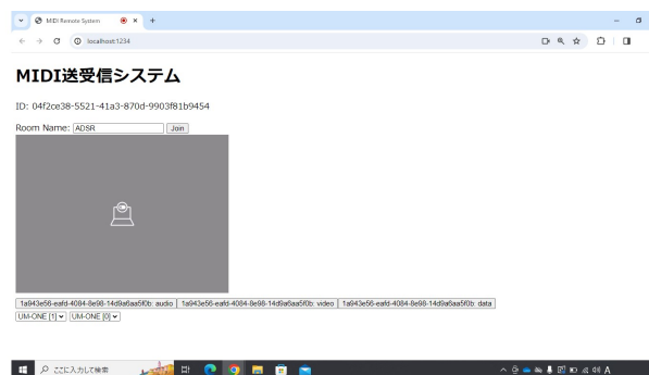
図 1 ソフトウェア画面

ドロップダウンで MIDI Input と MIDI Output を選択し、それぞれ指定されたデバイスを接続する。その後に任意の Room Name を入力し Join ボタンを押すと ID が発行される。通信する相手も同じ Room Name を入力し Join ボタンを押すと双方に相手の ID と通信するメディアが表示され、それを指定することで通信される。