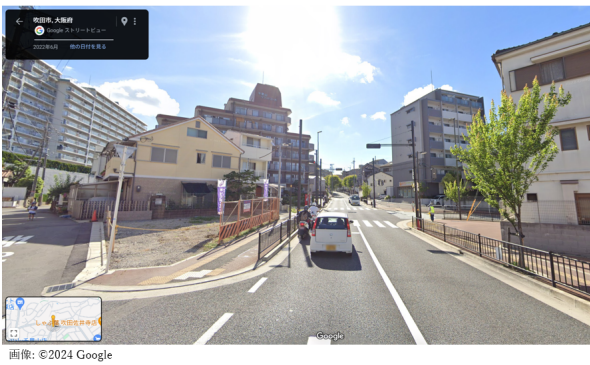
図 3: 高さが均一でない地物群

る場所、周りに何も地物がない場所などが考えられる。そして、同じような高さの地物が続く場所は、図 1、図 2 の左の写真のように景色が単調になる傾向にあると考えられる。逆に、図 3 のように地物の高さが均一でない場所であれば、各地物の高さの差による強弱があるため、メリハリのある景色になると考えられる。このような特性から、同じような高さの地物が続く場所においては、SV から BV へ切替を行うことで、経路動画が単調になる部分を省略しつつ、BV 視点から大まかな進行方向等を確認することが可能になる。