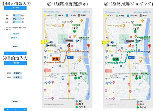
図 2: 経路推薦アプリ: 基本情報と出発地・目的地を入力すると肥満の程度により 3 種類の経路を推薦提示

速足やジョギングの速度から歩行の最短経路より長い距離を算出し、代謝量を増加させる。