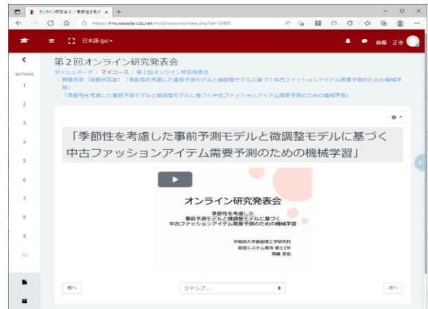
図1 LMS上のオンライン研究交流会のページ

以上が、我々がデザインした反転ゼミ形式オンライン研究交流会の骨子である。ICTを最大限に活用することで、オンデマンド形式が有効な部分(各自の理解スピードでプレゼンを理解する・各自のタイミングで質疑やコメントをする)とリアルタイムの議論が有効な部分(リアルタイムでの質疑やディスカッション)を切り分け、参加者が調整して集まった時間を最大限有効に活用している点がポイントである。