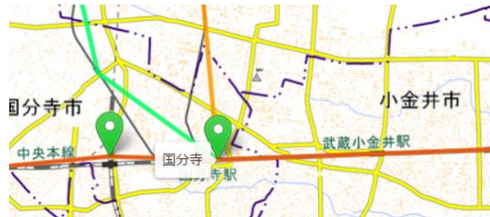
図 3: 乗り入れする路線の表示画面

駅で利用できる JR 中央線(濃い橙色)、西武国分寺線(緑色)、西武多摩湖線(薄い橙色)の経路が表示される。