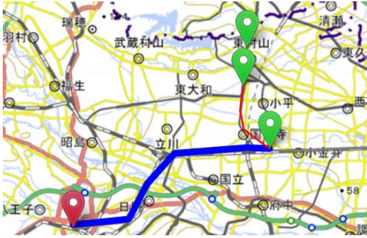
図 5: 再検索実行後の地図画面

のように地図上に自身で構成した経路が青線のみで繋がっている表示されるようになっている。