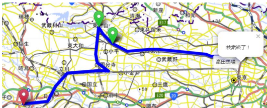
図 6: 再検索終了画面

のように地図上に自身で構成した経路が青線のみで繋がっている表示されるようになっている。