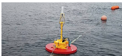
図2 海水温測定に用いたICTブイ

本アプリケーションはある漁船に搭載された魚群探知機から取得した魚群の量のCSVファイルを読み込むことで日付および漁船の名称を取得する。そして、仮想空間上の時刻に応じて実際に漁船が漁に出た時刻・航路および気象データを仮想空間上に表示する。