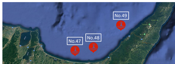
図1 ICT ブイの場所

ただし X は集合 \mathcal{X} の値をとる離散確率変数、 Y は集合 \mathcal{Y} の値をとる離散確率変数であり、 P(x, y) は X, Y に対応する同時分布、 P(x) および P(y) は周辺分布である。比較対象のデータにそれぞれの確率変数に対応する。本稿では、海水温と漁獲量の変化の相関関係を比較する。具体的に2隻の漁船FB-N, FB-Mから取得した漁獲3つのブイNo.47(経緯度43.9,144.6), No.48(経緯度43.9,144.6), No.49(経緯度44.1,145.0)から収集した各水深の海水温データとの相関を計算し、比較・分析を行った。ブイの設置場所と斜里町沿岸海域を図1に示す。