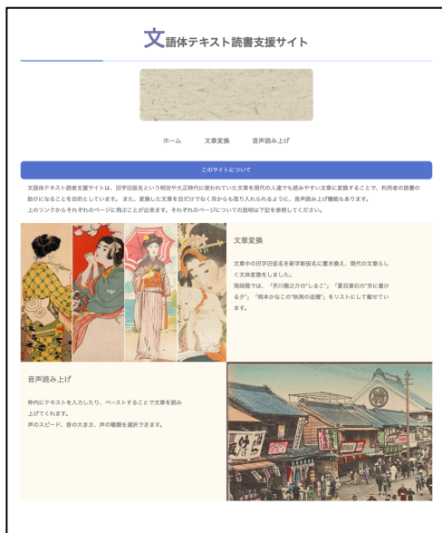
図 1 文語体テキスト読書支援ツールトップページ

小木曾ほかにより作成された歴史的日本語資料を対象とした形態素解析のための辞書[7]のうち、本研究では近代文語 UniDic[6]を使用した。形態素解析には、形態素解析システム MeCabを使用した[5]。