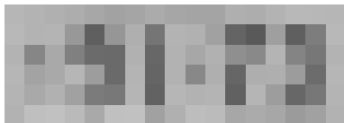
図 3: 実際のナンバープレート画像「9173」

に関する識別結果は、 P(5) = 0.490 , P(9) = 0.380 であった。