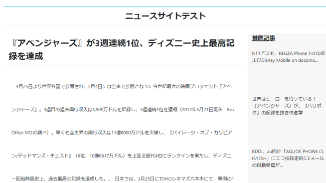
図2. Part of the site equipped with the proposal system.

今回、既読率が高いか低いかの判断については、「既読率が0.5を超えた場合には高く、0.5未満の場合には低い」というルールの下実験を行う。