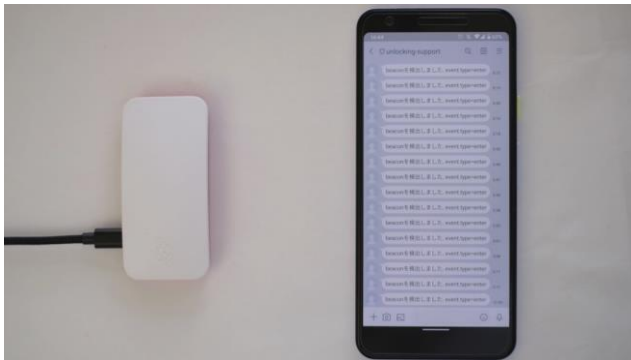
図 3 実際に動作する様子