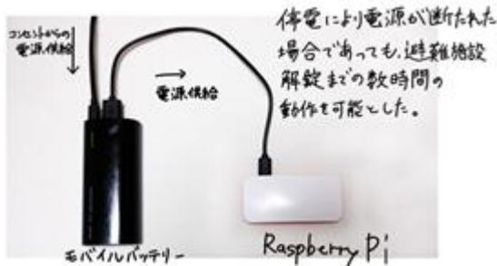
図 2 避難施設に設置するシステム

図 2 は避難施設に設置するシステム、図 3 は実際にスマートフォン上の LINE アプリにて、メッセージを受信表示させた図である。