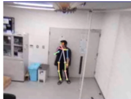
図 3 自由視点画像を用いた入退場の検出

以上に基づいた人の動線追跡手法を俯瞰画像合成システムに実装し、工場を模擬した実験を通じて動作検証を行った。天井高 3m の実験室に 9 台のカメラを格子状に設置し、これを天井高 10m の工場での運用と想定して実験を行った。このスケールに合わせて工場内の作業員