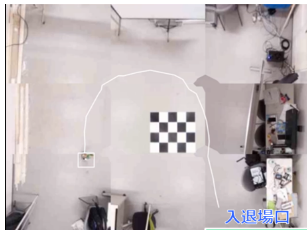
図 4 俯瞰画像の合成と動線追跡

を約 50cm の人形で模擬し、これを小型の台車型ラジコンに乗せてフロア内の人の移動を表現している。まず、天井の魚眼カメラから入退場口の自由視点画像を生成し、それに対して OpenPose による骨格抽出を行った結果を図 3 に示す。この結果より、適切に人および顔の検出が行われており、フロアへの入場と判定することできる。図 4 は、これに続いて俯瞰画像上で動線追跡(作業による停滞動作を含む)を行った結果であり、人の動線が適切に追跡・表示されていることを確認した。