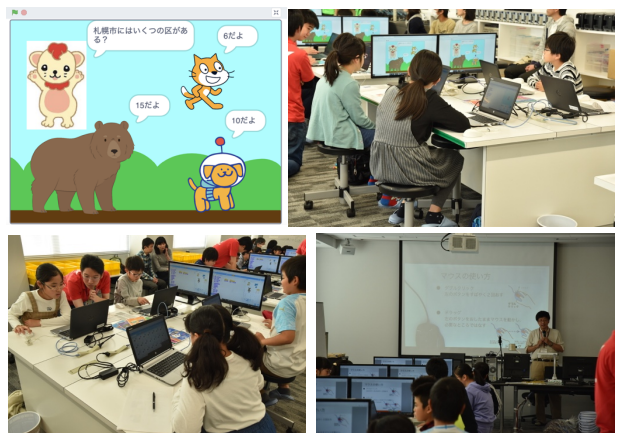
図 1 当日の会場の様子

開始時間になったら主催の札子連のスタッフの方の司会でスタートし、趣旨説明や挨拶などを行い、プログラミングワークショップ自体を開始する。まずはアイスブレイクとして各テーブル内で自己紹介を行う。札幌ではちょうど季節の替わり目だったので、好きな季節と名前などを順番に言ってもらおうこととした。テーブルを回ってみながら、しゃべるのが苦手な子には多少手助けなどを行った。