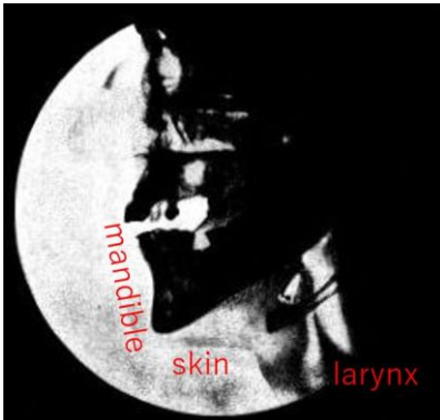
図 1 頤の発達により喉頭が降下して、母音を獲得。 [10]

また、今から 7 万 2000 年前に始まるスティールベイ文化は、トバ火山噴火の後の火山灰の冬の時期に、クリック子音を音素として共有して始まった。おそらくみんなで一緒に歌を歌っているときに、自然発生的に同じ音を出すようになり、音素として確立したのではないだろうか。