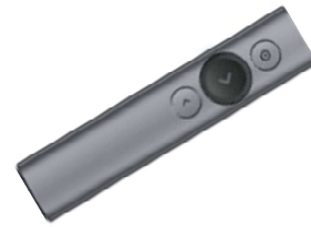
図 2 リモートコントローラー (ロジクール Spotlight プレゼンテーション リモート)

本実験で使用したリモコンは「ロジクール Spotlight プレゼンテーション リモート[6]」である。USB レシーバーまたは Bluetooth を用いた接続で、スクリーン上のカーソルをコントロールすることができるリモコンである。内部に搭載されている加速度センサーによって、リモコンのボタ