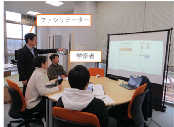
図 1 スクリーンを用いたグループ学習の場面

近年、離れた位置にある画面に対しての NUI(Natural User Interface)として非接触操作システムの開発が進められている。グループ学習を促すために 1 つのスクリーンや大型ディスプレイを共有して行われるアクティブラーニング環境も非接触操作システムの導入が期待される分野のひとつである。アクティブラーニング環境における NUI では、マウス操作のような操作精度よりも指導者がすぐに操作でき、学修者と画面上の情報を指差して共有できることが求められる。本研究では、アクティブラーニング環境における操作の指標として即応性について検討し、ファシリテーターの振る舞いによる即応性（操作）と学修者の認知を含む即応性（認知）を定義する。またアクティブラーニング環境におけるポインティングデバイスごとの即応性を評価する実験を行った。