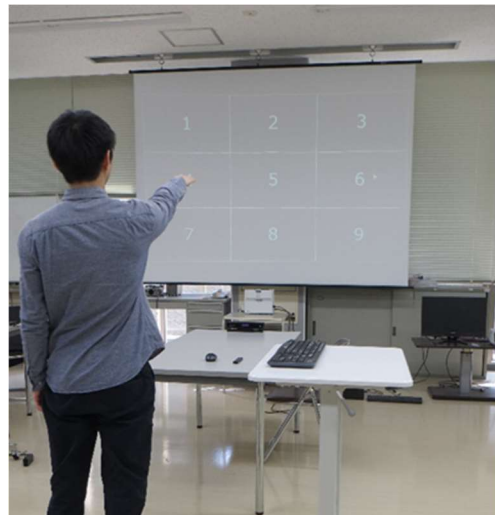
図 3 Remote Touch Pointing