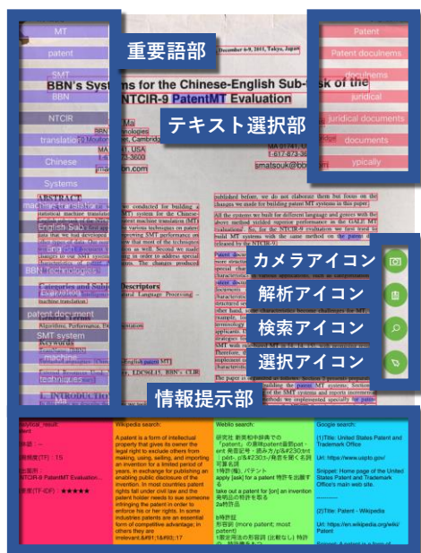
図 1 リアルタイムマルチインタフェース[1]の画面

近年タブレット端末の普及により、電子文書の閲覧支援に関する研究が行われている。谷尻ら [1] は、タブレット端末のカメラ機能を用いて紙媒体の論文のテキストをリアルタイムに検出し、論文中的重要語や Web の関連情報等を表示するリアルタイムマルチインタフェースを提案した。図 1 は、そのブラウザの画面であり NTCIR-9 の PatentMT で発表された Jeff らの論文 [2] が表示されている。起動時、ブラウザにはタブレット端末のカメラが写している画面、複数のアイコンが表示される。論文の任意のページを画面に写してカメラアイコンを押すと、撮影した静止画が表示される。その後解析アイコンを押すと検出された画面上の赤い矩形内のテキストが読み込まれ、重要度が算出され重要語が表示される。重要語部やテキスト選択部に表示される語をタップすると、情報提示部にその語の重要度や出現頻度といった解析結果 (赤) や Wikipedia (橙)、Weblio (緑)、Google (青) での検索結果が表示される。これらの検索結果をタップすることで各々の Web ページに移動できる。論文中の赤い矩形をタップすると矩形内のテキスト中の単語がテキスト選択部に表示される。その他、情報提示部の表示と非表示を切り替える検索アイコンや、赤い矩形の表示と非表示を切り替える選択アイコンがある。学術論文に含まれる未知の専門用語等を辞書や Web で逐一検索するのは効率が悪いので、谷尻らのインタフェースは有用である。しかしこのインタフェースは履歴機能を持っていないため論文を再度閲覧する際、論文の重要箇所を再び探