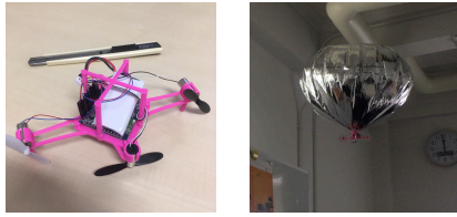
図 3: 試作機

可能である。しかしながら我々の目的では、これに加え最低1つのカメラとマイクを備える必要があり、その情報を無線通信で外部のサーバに送ることができなければならない。BLE通信を使えば低消費電力で音声送信程度は可能であるが、通常の動画並のフレームレートでの画像送信は難しい。WiFi通信を使えば帯域幅の問題はないが、電力消費が著しく増えてしまう 3 。通信を減らすためにオンチップでの計算処理を増やせば、今度はその消費電力が問題となり、アルゴリズムまで考慮したハードウェア設計が必須となる [22]。