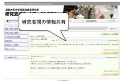
図 3. 機器毎の掲示板