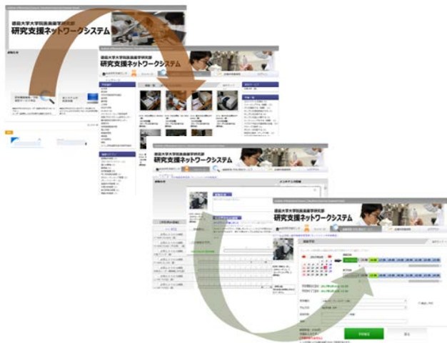
図 2. ユーザーインターフェースとユーザビリティ

機器毎に掲示板を設置することは、共用取組みの支援として研究者間の情報共有のみならず機器の運用者と利用者間の距離を縮めることに繋がる(図 3)。しかし、共有研究機器の情報収集や、知識データベースだけでは最新の情報や技術の進歩に対応することは困難である。そこで、徳島大学では有料広告掲載を制定しており、関連した企業と協力体制を構築することで、最新の技術、機器に対応する試薬等の情報を利用者へ柔軟に提供している。