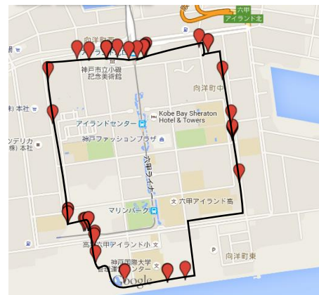
図 2 移動の軌跡とバリア情報

図 2 に示すバリア情報として判定した結果を確認したところ、舗装されていない道や砂利道、坂を下りきった後の勾配変化に伴う段差などが抽出した。このことから、車いす利用者にとって移動し難い場所を抽出できたとと言える。