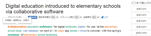
図3 記事閲覧ページ

図3に示すように、記事閲覧ページでは、記事タイトル、本文を提示する。また、本文に対しては、スラッシュリーディング機能や単語の品詞による色分け機能などで読解を支援する。これらの機能については、機能のON/OFFを自由に変更できるようにボタンを用意している。