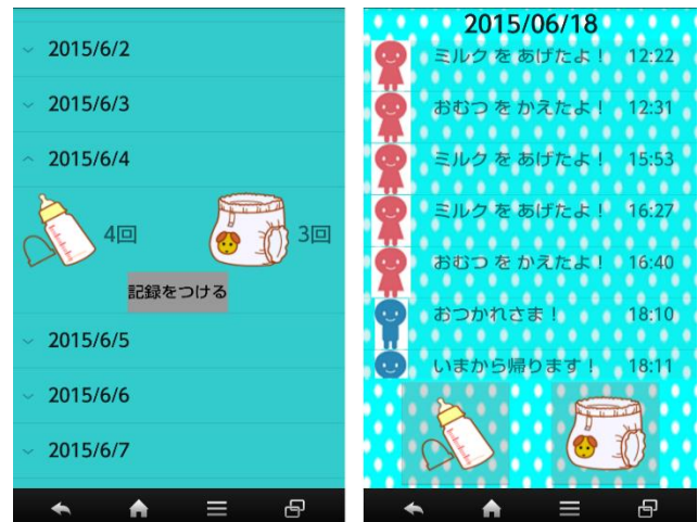
図3 アプリケーション ver.1 画面