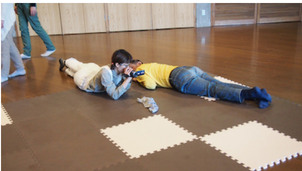
図4 他者と対称になる

しかし、B さんを避けているように見えた A 氏のその後の行動を見ていると、違う見方が可能であることに気づいた。A 氏は、さらに身体を動かす続け、ちょうど B さんと点対称になる位置で静止したのだ[図4]。