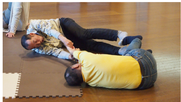
図2 身体の一部を触れ合わせながら起き上がる

この状態では、双方の押し合う力によって互いの身体の間で平衡状態が生まれているように感じられた。しばらくお互いが押し合う状態が続いた後、舞踊家が身体をひねり始める。ひねる動作が足の裏から伝わったのだろうか A氏も身体をひねりはじめる。そこからは、身体の一部を触れ合わせながらお互いの身体の模倣が続いていく[図2]。