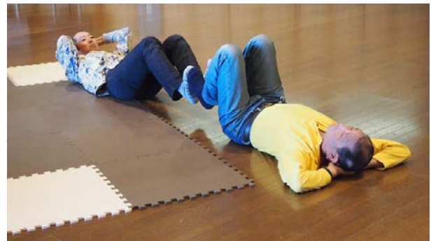
図1 足の裏を触れ合わせ身体動作を真似し合う

家)とのダンスセッションを対象に調査を進めている。ダンスは即興で、A氏は舞踊家の身体動作を模倣しダンスを成立させている。ここでは或る日のダンスセッションをもとにA氏の模倣についての考察を述べたい。ダンスセッションの始まりは、多くの場合舞踊家がA氏に注意を向け、その身体の一部に触れるところからはじまる。この日は、二人が寝転んだ状態で足の裏を触れ合わせる状態になる[図1]。