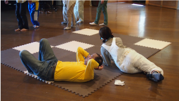
図3 他者を避けるような動き

転がったまま、くつろいだように見える状態になった。興味深い出来事があった。スタッフの身体が偶然に A 氏の足先に触れたときのことだ。足先に他者の身体が触れた瞬間、それに A 氏は反応し身体を動かした。そして、スタッフを避けるように A 氏は身体を動かさしはじめた[図3]。