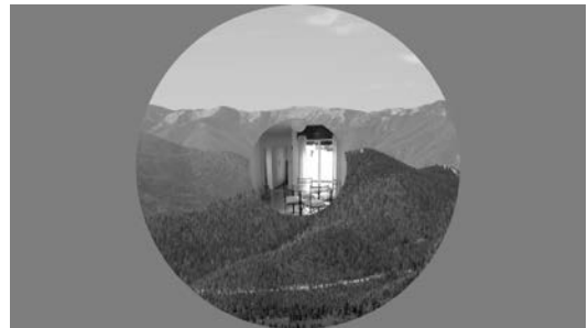
図 1 提示画像の例

画像の提示時間は 50ms と 100ms の二条件とした. それぞれの提示時間に対して、試行回数は 60 回に設定し、30 回を同種のカテゴリ(自然:15 回, 人工 15 回)の組み合わせとし、残りを異種のカテゴリ(中心視野: 自然 (人工) × 周辺視野: 人工 (自然) それぞれ同数)の組み合わせとした. 同じ画像は 1 回の試行でのみ用いた. 同種, 異種の試行はランダムな順番で行った.