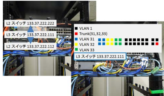
図 1 ネットワークトポロジーの可視化例