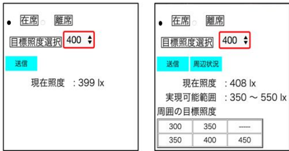
[a] 実現可能範囲を表示しないUI [b] 実現可能範囲を表示するUI Fig.1 作成した知的照明システムのUI