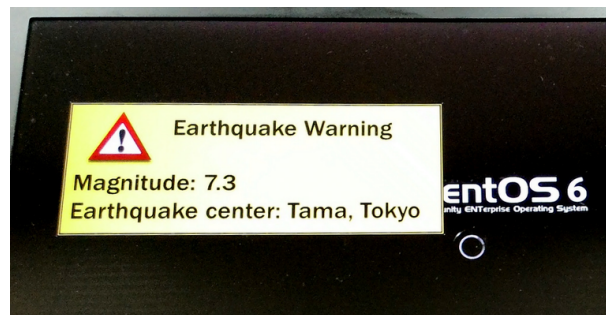
図 2 洪水警報が表示された Linux の OS 起動画面

DisasVisor の構成を図 3 に示す．PC はグラフィックスとネットワークのためのハードウェアを備えているものとする．また，BitVisor を利用するため，CPU は VT などの仮想化支援機構を備えている必要がある．ゲスト OS とハイパバイザはともに自身が持つデバイスドライバによってそれらのハードウェアを操作する．DisasVisor はゲスト OS による I/O 操作の一部を捕捉するが，グラフィックス