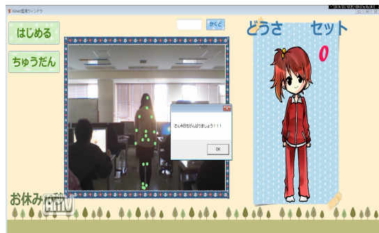
図3 運動支援のスタート画面

図3に運動支援のスタート画面を示す。画面上の「はじめる」ボタンを押して運動をスタートする。画面には高齢者の動作ポーズに合わせてイラストがリアルタイムに表示される。高齢者はイラストのポーズ通り、または音声の指示に合わせてゆっくりと動作する。もし上肢の動作が的確な高さや動きであれば毎セットごとに「ピー」という音が鳴り運動とポーズが同期しやすいようにした。