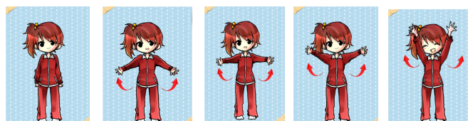
(1):初期 (2):脇下 (3):水平 (4):脇上 (5):頭上

高齢者の運動ポーズは、太極拳の「練功十八法一段」の動きを取り入れた 5 種類とする。図 1 に運動のポーズを示す。図 1 の(1)は両手を体の下側に着けて運動を開始するポーズ、(2)は両手を脇下斜めに保つポーズ、(3)は両手を水平に保つポーズ、(4)は両手を脇上斜めに保つポーズ、(5)は両手を頭上に万歳を保つポーズとし、各ポーズでは同じポーズを 2 秒間保つものとする。