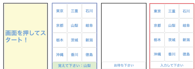
図 1. 実験の流れ(上)と実験アプリケーションの概観(下)

名をランダムで表示した。また、画面遷移された旨が解るよう、その旨を音声で提示した。