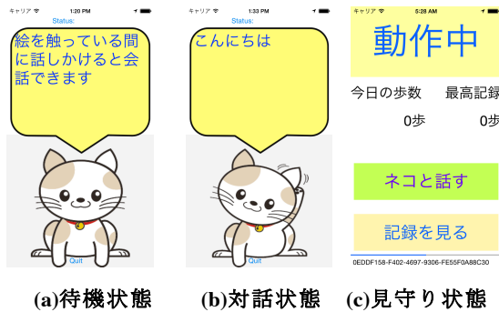
図4 生活行動記録システム画面