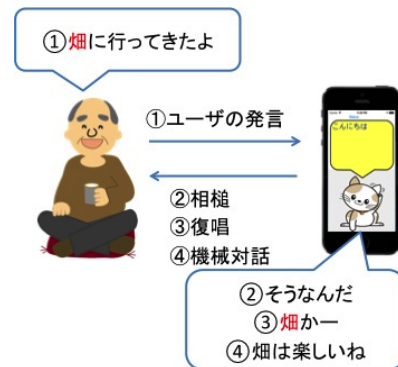
図 1 キャラクタエージェントとの対話

るために専用のデバイスを使用しなければならない。さらに、誰がその商品を使用するのかなど、目的がわからない場合がある。さらに、食事行動記録の簡便化を目的として、過去の食事記録に関する統計情報を利用して、食事内容の入力操作を軽減する手法が提案されている[11]。この手法は、過去の食事内容・時刻・場所から食事傾向を推定し、過去の食事時刻と記録時刻から記録に適切なタイミングにリマインダを送信することで、ユーザに食事記録を促す。本研究においても、キャラクターエージェントが食事に関する質問をするタイミングについて注意しており、ユーザが在宅している時のみとしている。