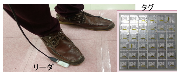
図2: 床面に敷き詰められたタグ及びリーダ装着状況