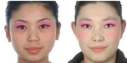
図5 左: 選択した化粧 (図3右), 図2の素顔に適用し、仮想化粧を施した結果

図4 左: 選択した化粧 (図3中), 右: 図2の素顔に適用し、仮想化粧を施した結果