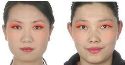
図4 左: 選択した化粧 (図3中), 右: 図2の素顔に適用し、仮想化粧を施した結果

図3 色検索キーとして暖色を指定した場合の検索結果 選択された2つの顔からそれぞれ化粧成分を抽出し、TPS(Thin Plate Spline) [5]を用いてユーザの顔の形状に合致するように変形し、ユーザの顔に仮想的に化粧を施す。図2の素顔に、図3の中と右顔画像を選択して仮想化粧を施した結果をそれぞれ図4と図5に示す。