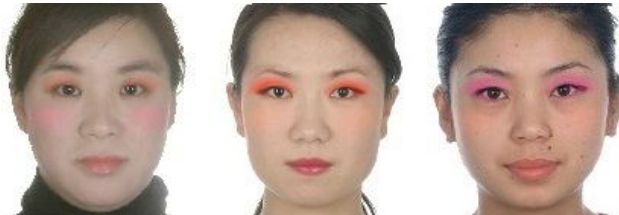
図3 色検索キーとして暖色を指定した場合の検索結果 選択された2つの顔からそれぞれ化粧成分を抽出し、TPS(Thin Plate Spline) [5]を用いてユーザの顔の形状に合致するように変形し、ユーザの顔に仮想的に化粧を施す。図2の素顔に、図3の中と右顔画像を選択して仮想化粧を施した結果をそれぞれ図4と図5に示す。

ユーザは検索結果を見て、気に入った化粧が一つある場合には、その化粧データを選択する。この場合、本システムはユーザの入力した画像に、指定した化粧を施した仮想化粧画像を生成して表示する。図2の入力画像を使用し、検索処理を行った例を図3に示す。検索には顔と目の輪郭の特徴点を用い、暖色を指定した。これらの結果から、検索条件に応じた検索結果が表示されていることがわかる。