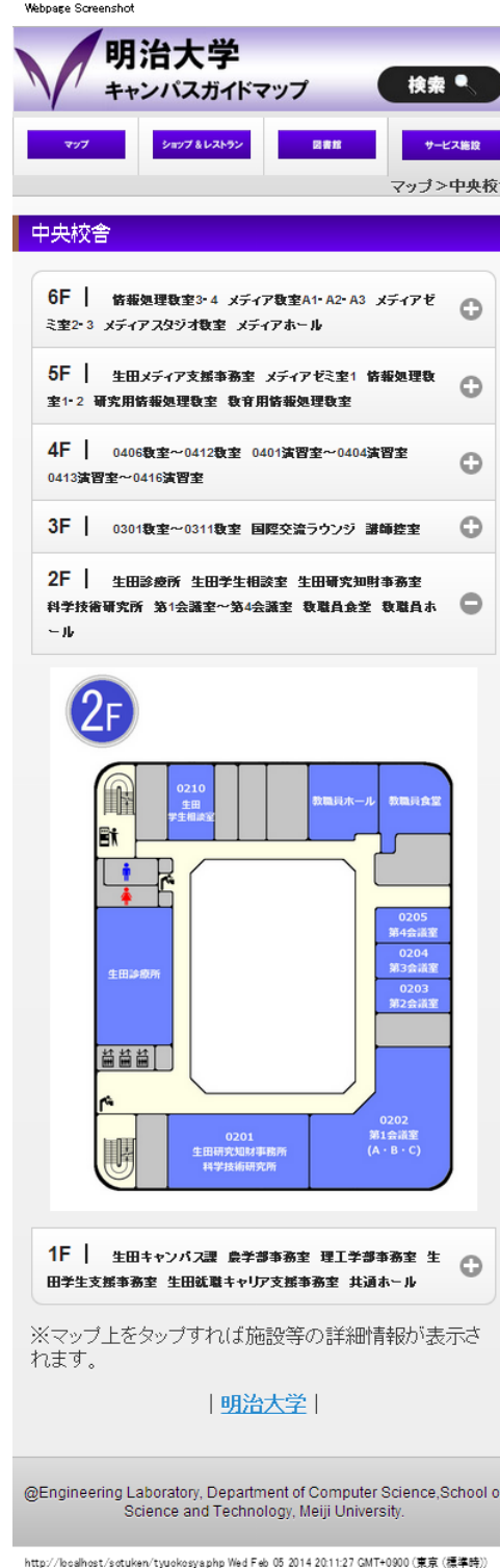
図3 フロアガイドマップ

図書館については、既存の明治大学公式Webアプリ(iMeiji)で、新入生や来訪者向けの情報提供が行われているので、そのサイトへのリンクを付けることで対応することにした。