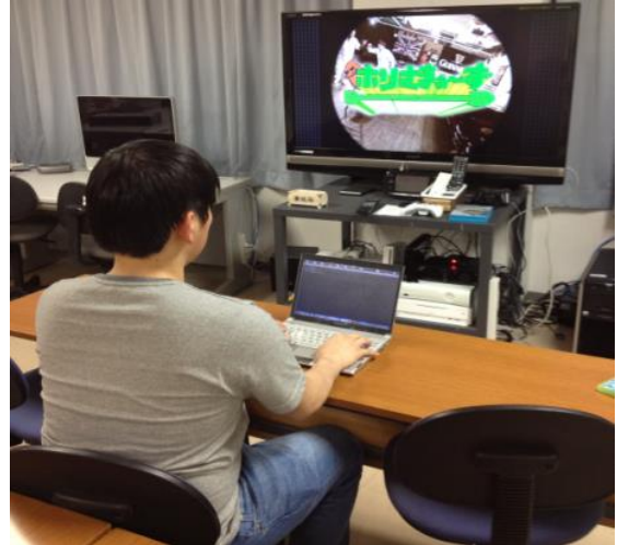
図 1: 実験風景

番組終了後、直ちに筆記によるアンケートにて、バラエティ番組に関する質問や、番組視聴とボタン操作との両立のしやすさに関する質問を選択式で答えてもらい、面白かった場面やイマイチだった場面は、どこであったかを記述式で答えてもらった。又、被験者に過度な負荷が掛からないよう、アンケートへの記述量は提示せず、自由に記入してもらった。