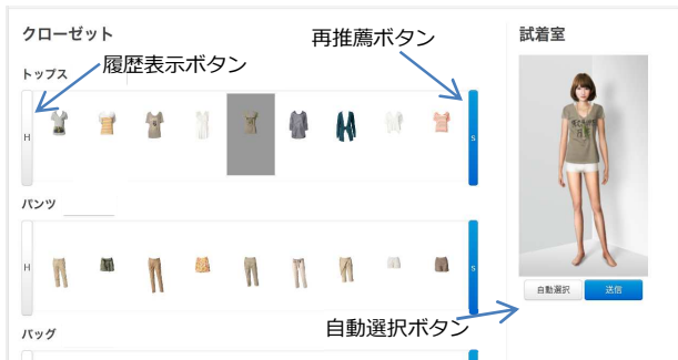
図 1 ユーザインタフェース

候補として表示された衣服の中に気に入ったものが無かった場合、「再推薦ボタン」を押すことで再度推薦を行い、候補を更新することができる。また、以前に着用させた服をもう一度見たくなくなった際は、「履歴表示ボタン」を押すことで選択した衣服の履歴を見ることが出来る。また、「自動選択ボタン」を押すと未選択のカテゴリについて候補をランダムに組み合わせてコーディネートを生産する。