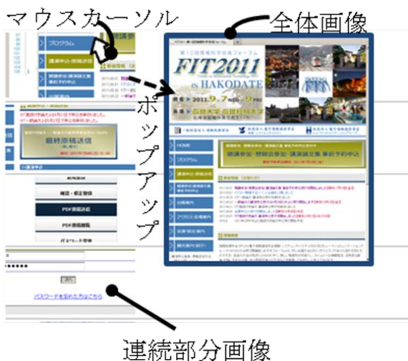
図2 出力した表示部の結果のサンプル

をキャプチャ機能により取り込む。さらに HTML 作成機能により全体画像と部分画像を表示する HTML ファイルを生成する。HTML ファイルはマニュアルなどとしての利用を想定したもので、ユーザは Web ブラウザで閲覧可能である。部分画像を連続的に並べポップアップとして全体画像を表示するタイプ【部分】と全体画像を連続的に並べポップアップとして部分画像を表示するタイプ【全体】の 2 種類の HTML を生成できるようにしてある。