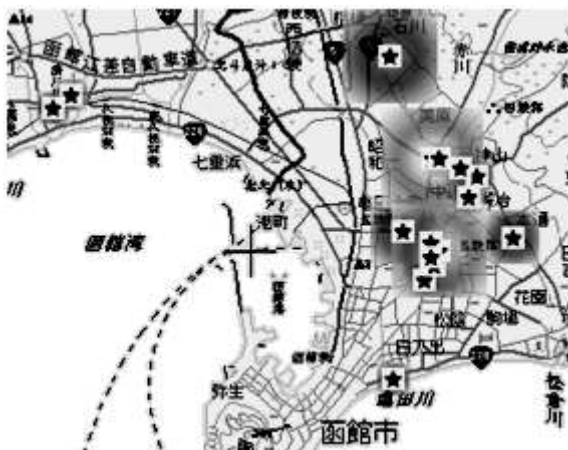
図2 フェロモンで表現した BFM

また、モバイル版では現在位置をシステムに送信することで周辺のフェロモン情報を検索することができる。すなわちモバイル端末はアリの鋭い嗅覚の役割を果たす。