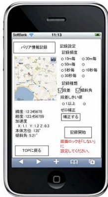
図2 バリア情報収集・投稿画面

②Safariを起動し、3Gパケット通信またはWifiを利用してバリア情報収集・投稿システムのWebページにアクセスする。図2のような画面が表示される。