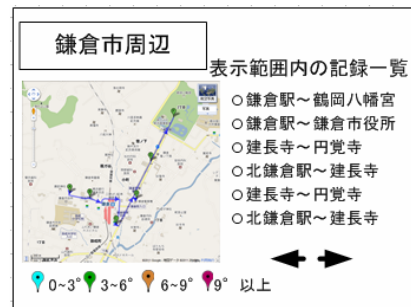
図4 バリア情報の確認

②画面左側にgoogleマップ、画面右側に表示地図周辺の記録ルートが表示される。表示したいバリア情報のルートを選択すると、googleマップ上にそのルート上の傾斜角度と段差情報がマーカーで表示される。