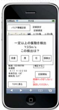
図3 バリア検出画面

⑥一定以上の角速度の変化を検出すると、図3のようなアラートポップアップが表示される。表示された選択肢の中に、段差、溝、石、誤検出の4項目が表示され、実際の状況にあったものを選択する。誤検出を選択した場合は記録されない。