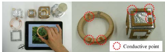
図1: システム構成と物理オブジェクトの例