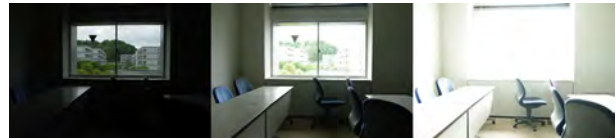
図 2: HDR 画像合成に用いる露出画像