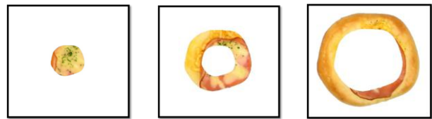
(a)内側 (b)中央 (c)外側 図2 パンの領域分割(同心円状)