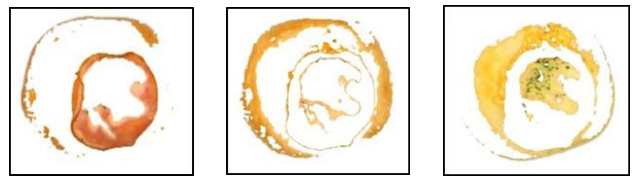
(a)領域1 (b)領域2 (c)領域3

次に、最も識別率の高かった分割数 4 のときの色特徴と形状、テクスチャの特徴を合わせて計 80 種類の特徴量を用いて同様に識別実験した結果を表 2 に示す。表 2 より、第 1 候補の識別率は、96.2% となり、同心円状の領域分割を用いた場合に比べ識別率が大きく向上したことがわかる。